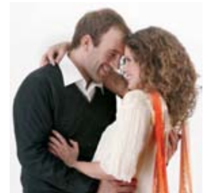
Besondere Momente und wahre Werte: Seite 16