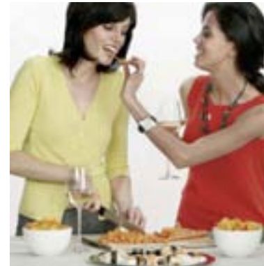
Ein Abend unter besten Freundinnen: Seite 4