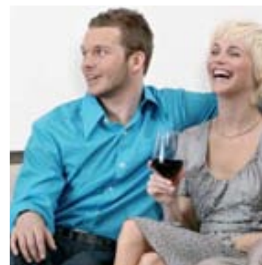
Ein Sonntagsessen, Wein und kleine Preise: Seite 20