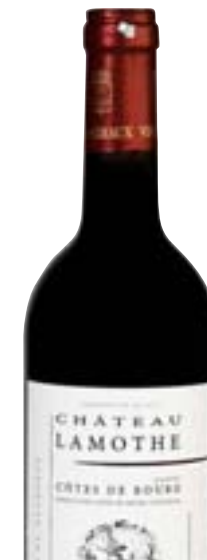
Die komplette Preisliste: Seite 24