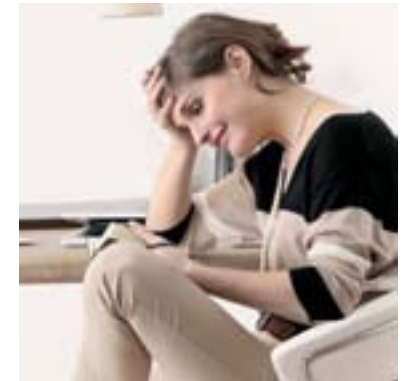
Entspannung pur und Preise zum Relaxen: Seite 8