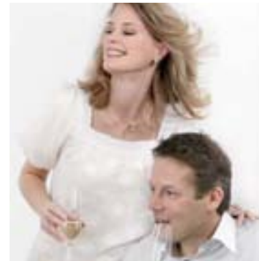
Geschenke für alle Anlässe: Seite 12