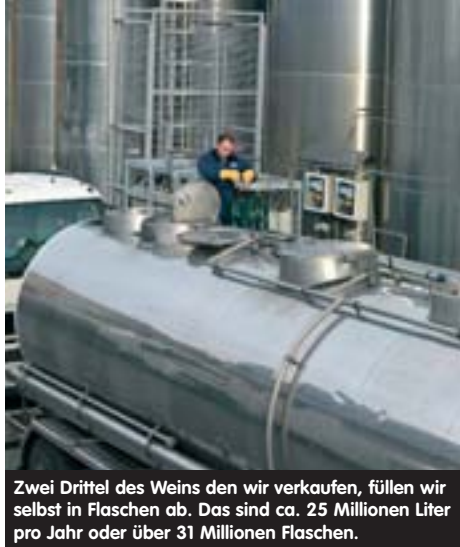
Zwei Drittel des Weins den wir verkaufen, füllen wir selbst in Flaschen ab. Das sind ca. 25 Millionen Liter pro Jahr oder über 31 Millionen Flaschen.

Der Fruchtanteil, bei bestimmten Weinesorten, hält sich am besten in einer Flasche mit Schraubverschluss. Die Flasche ist hermetisch verschlossen und der Wein läuft nicht Gefahr, nach Kork zu schmecken (zu „körkeln“). In vielen angelsächsischen Ländern wird daher der Schraubverschluss schon bevorzugt verwendet.